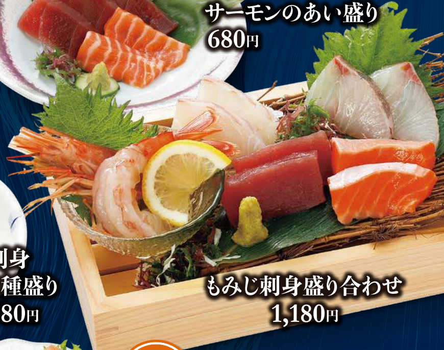
もみじ刺身盛り合わせ 1,180円