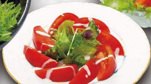
冷やしトマトサラダ 480円