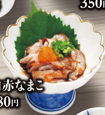
瀬戸内赤なまこ 380円