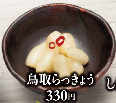
鳥取らっきょう 330円