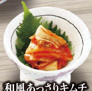
和風あっさりキムチ 300円