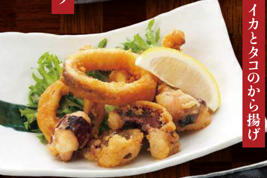
イカとタコのから揚げ