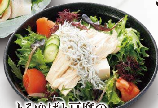
とろゆばと豆腐の しらす盛りサラダ 780円