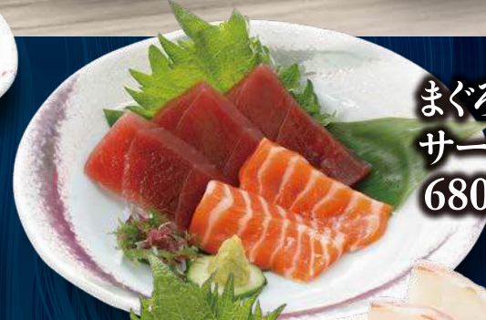
まぐろと サーモンのあい盛り 680円