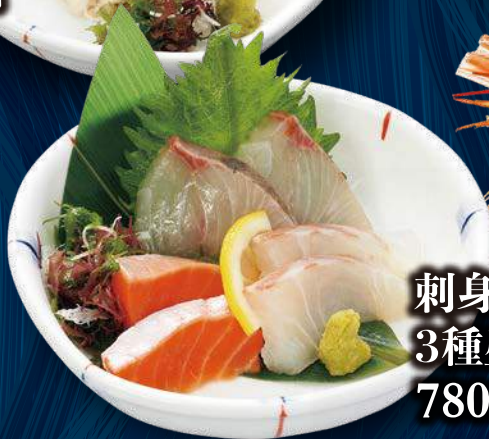
刺身 3種盛り 780円