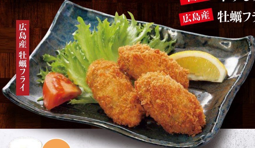
広島産牡蠣フライ