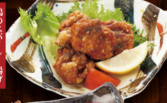
鶏のスパイシー揚げ