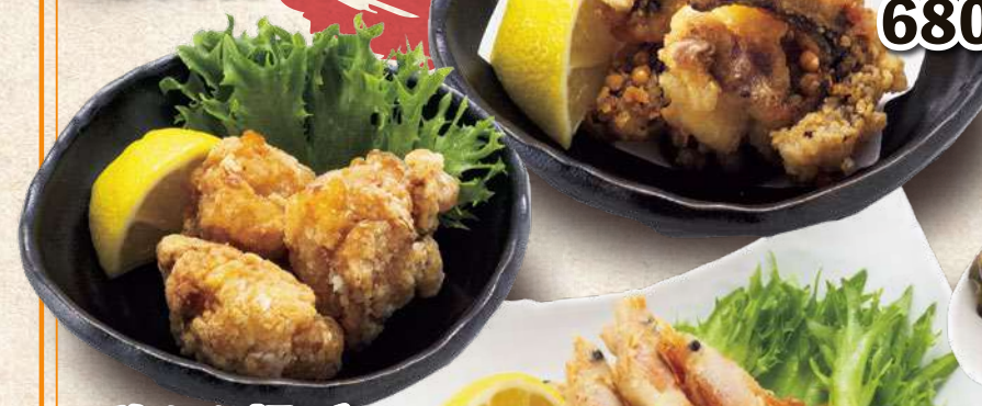
鶏から揚げ 3個 520円