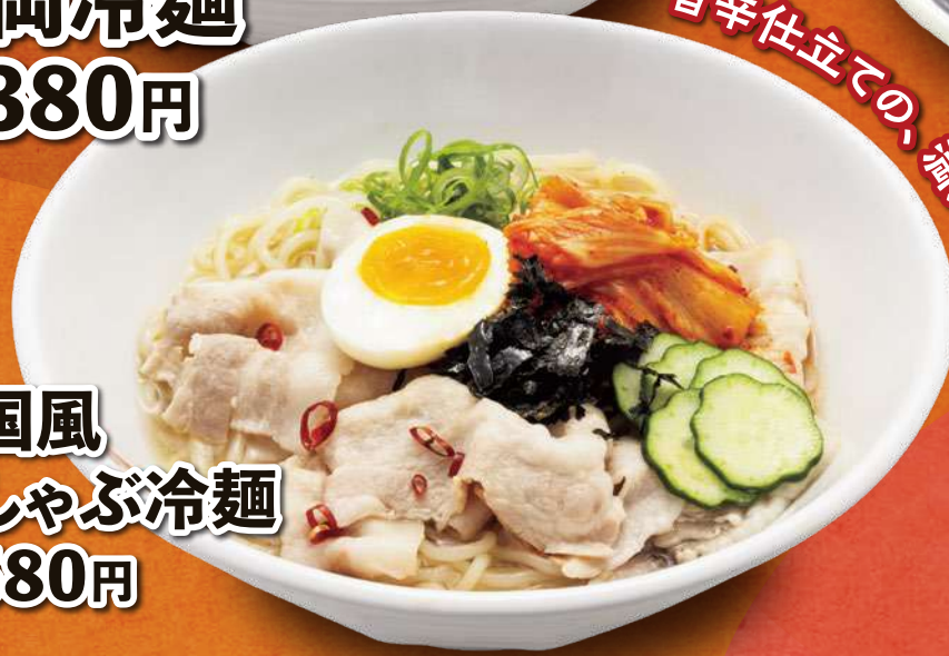
韓国風 豚しゃぶ冷麺 1,580円