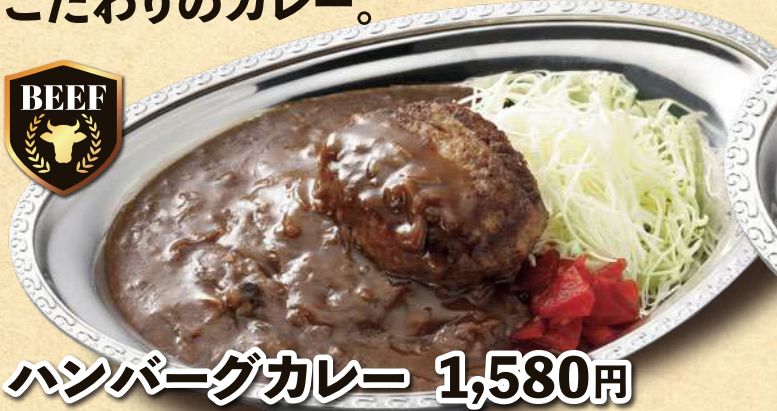
ハンバーグカレー 1,580円