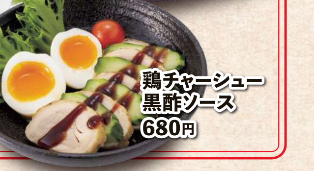
鶏チャーシュー 黒酢ソース 680円