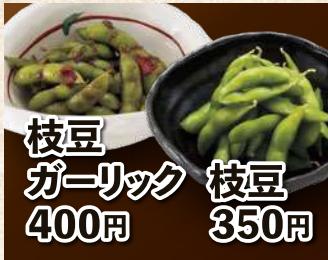
枝豆 ガーリック 枝豆 400円 350円