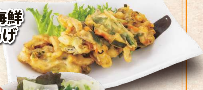
つまみ海鮮 チヂミ揚げ 580円