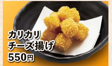
カリカリ チーズ揚げ 550円