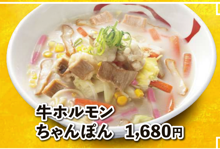
牛ホルモン ちゃんぽん 1,680円