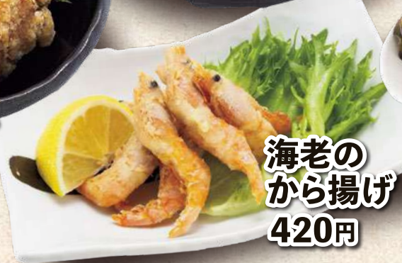
海老の から揚げ 420円