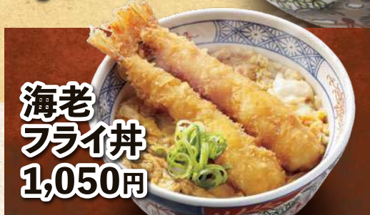
海老 フライ丼 1,050円