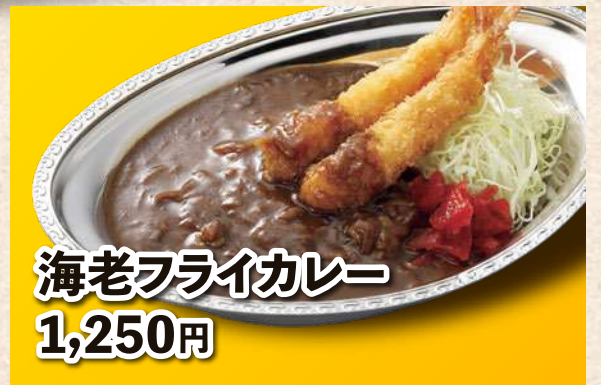
海老フライカレー 1,250円