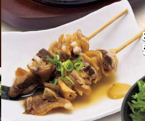
牛すじ煮込み串 750円