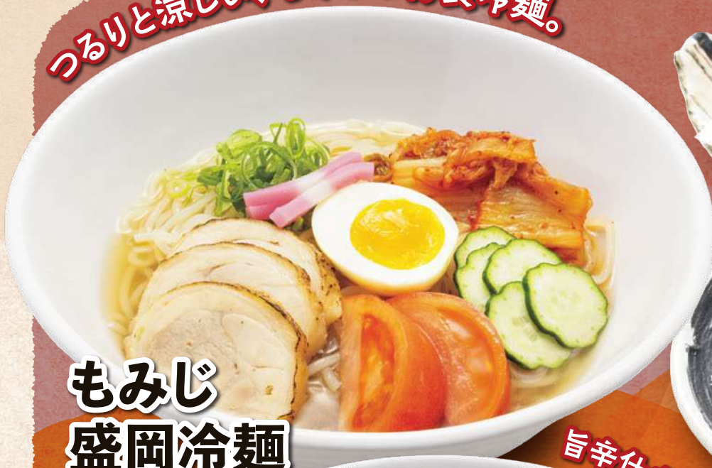
もみじ 盛岡冷麺 1,380円