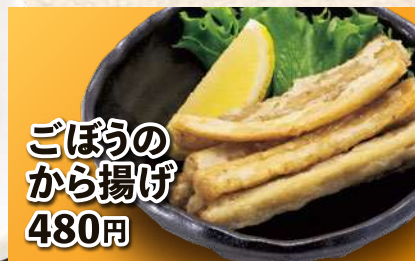
ごぼうの から揚げ 480円