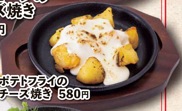
ポテトフライの チーズ焼き 580円