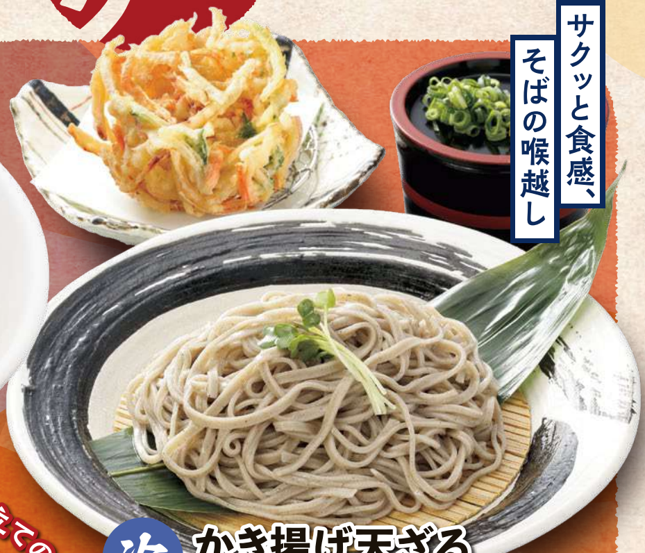
冷 かき揚げ天ざる うどん・そば 1,180円