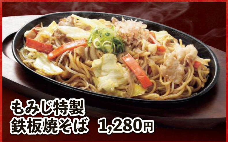
もみじ特製 鉄板焼そば 1,280円