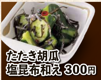
たたき胡瓜 塩昆布和え 300円