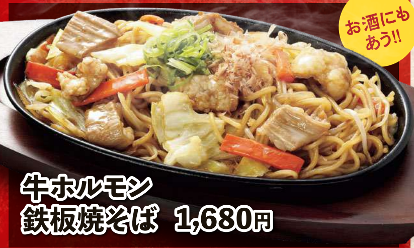
牛ホルモン 鉄板焼そば 1,680円