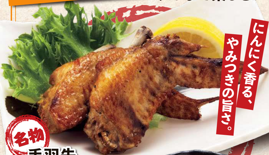
手羽先 スタミナ揚げ 500円