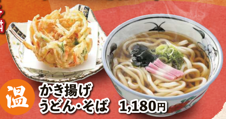
温 かき揚げ うどん・そば 1,180円