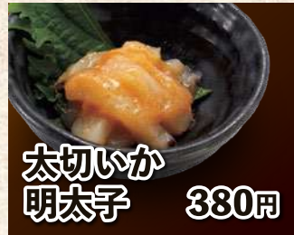
太切いか 明太子 380円