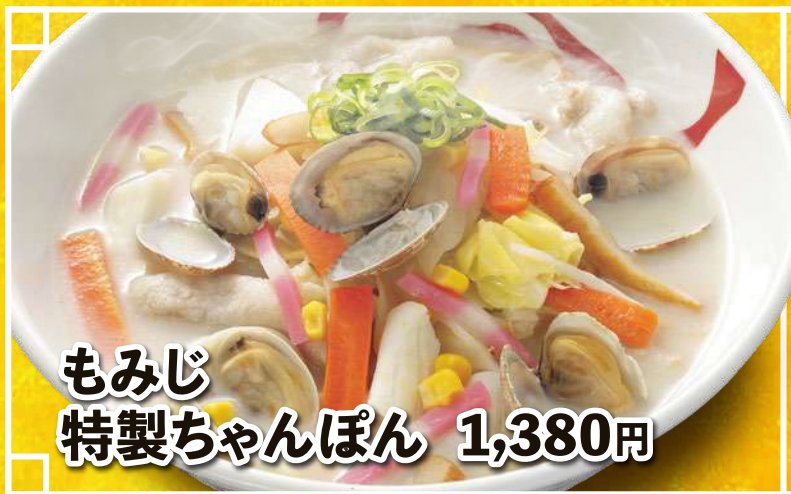
もみじ 特製ちゃんぽん 1,380円