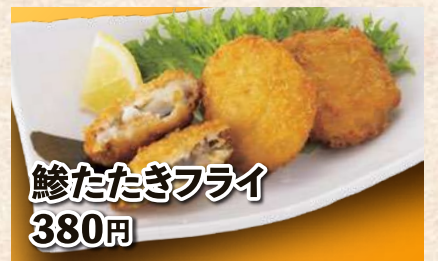
鰻たたきフライ 380円