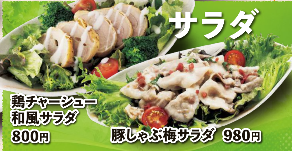
鶏チャーシュー 和風サラダ 800円