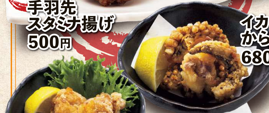
イカの から揚げ 680円