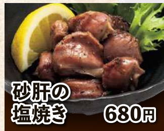
砂肝の 塩焼き 680円