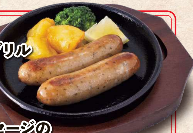
ソーセージの チーズ焼き 850円