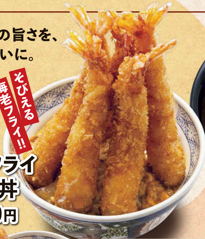
海老フライ タワー丼 1,680円