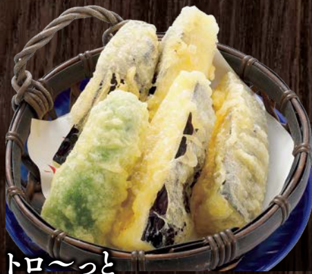
トロ〜と ナス天ぷら…… 450円(税込)