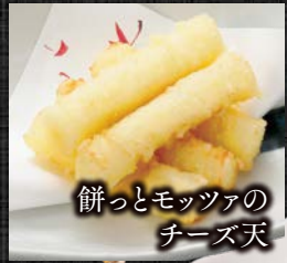
餅っとモッツァの チーズ天