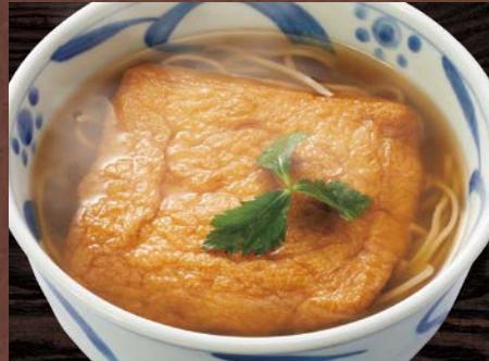
大判きつねそば 900円(税込)