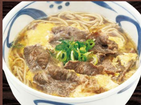
和牛卵とじそば 1,250円(税込)