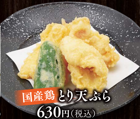
国産鶏とり天ぷら 630円(税込)