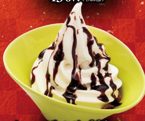
チョコパリソフト 380円(税込)