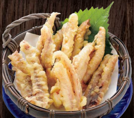
イカ天ぷら…… 680円(税込)