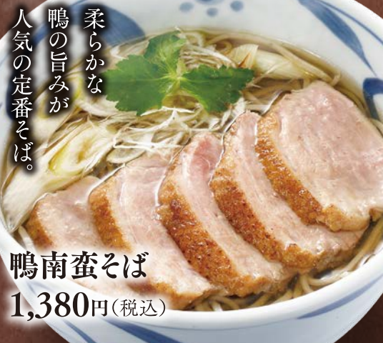
鴨南蛮そば 1,380円(税込)