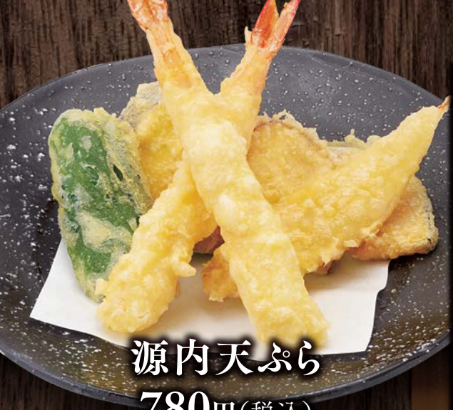
源内天ぷら 780円(税込)