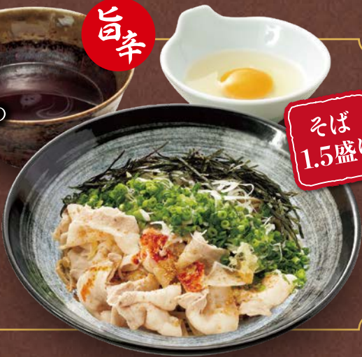
辛味肉そば 1,380円(税込)