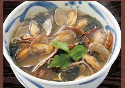
あさり海苔そば 1,200円(税込)