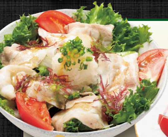
豚しゃぶ サラダ仕立て 850円(税込)