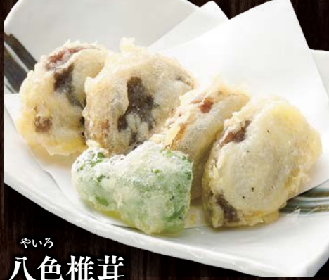
やいろ 八色椎茸 天ぷら…… 580円(税込)