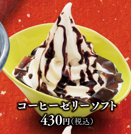
コーヒーゼリーソフト 430円(税込)