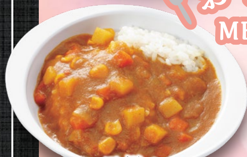
お子様カレー 480円(税込)