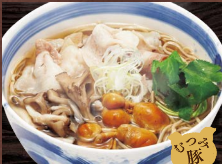
むつみ豚きのこそば 1,280円(税込)

美味しく食べるコツ!! 温かい十割そばは伸びやすいので お早めにお召し上がりください。