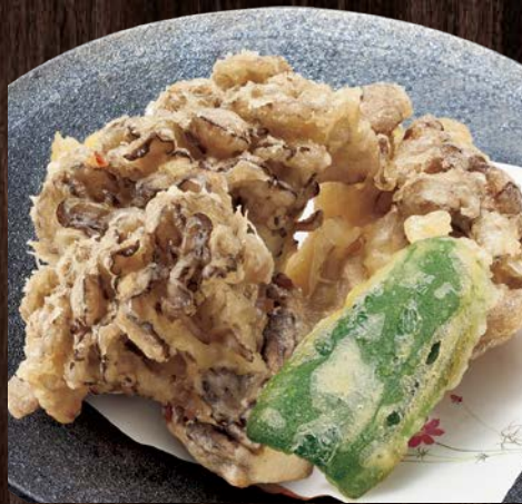
舞茸天ぷら…… 730円(税込)