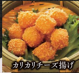
カリカリチーズ揚げ