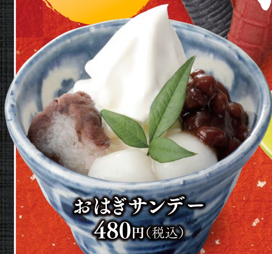
おはぎサンデー 480円(税込)