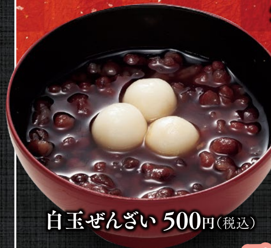
白玉ぜんざい 500円(税込)