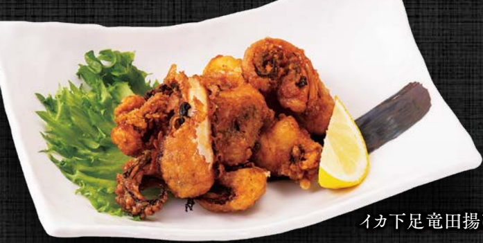
イカ下足竜田揚げ