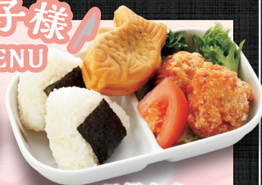
お子様弁当 580円(税込)