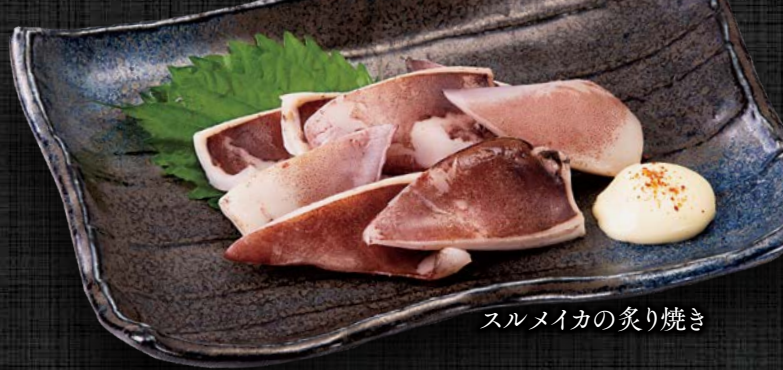
スルメイカの炙り焼き