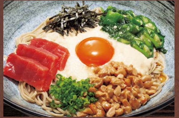
本まぐろネバネバそば 1,480円(税込)