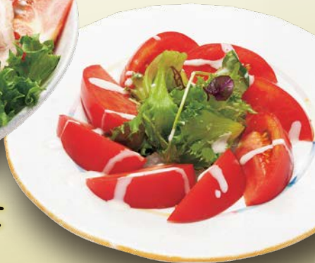
冷やしトマトサラダ 650円(税込)