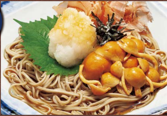
信州なめこおろしそば 1,080円(税込)