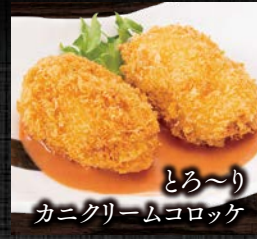
とろ〜り カニクリームコロッケ