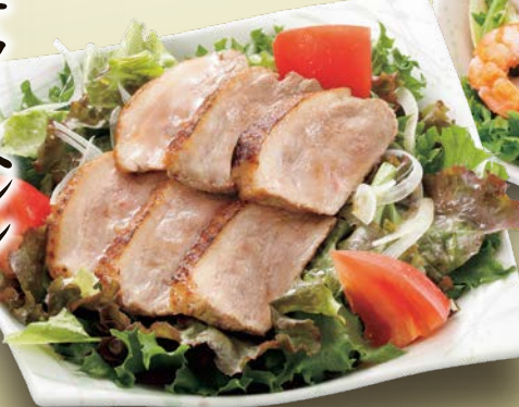
鴨ローストサラダ風 750円(税込)