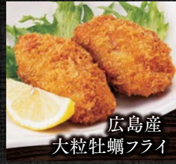
広島産 大粒牡蠣フライ