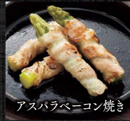
アスパラベーコン焼き