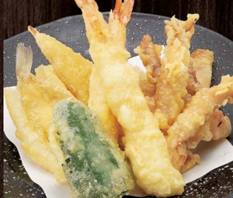
海鮮天ぷら…… 980円(税込)