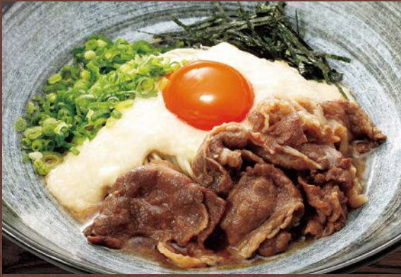
和牛とろろそば …… 1,380円(税込)