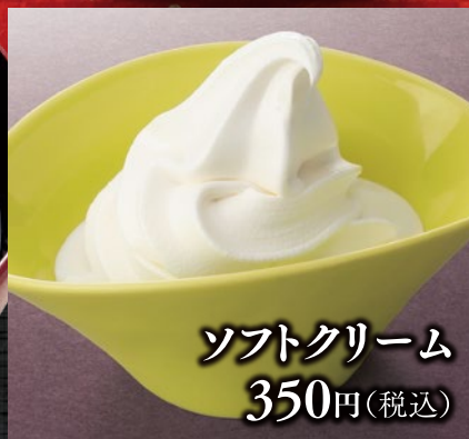
ソフトクリーム 350円(税込)