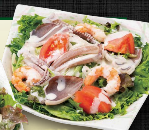
海鮮シーザー サラダ 780円(税込)