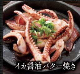
イカ醤油バター焼き