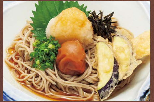
紀州梅おろしそば… 1,180円(税込)